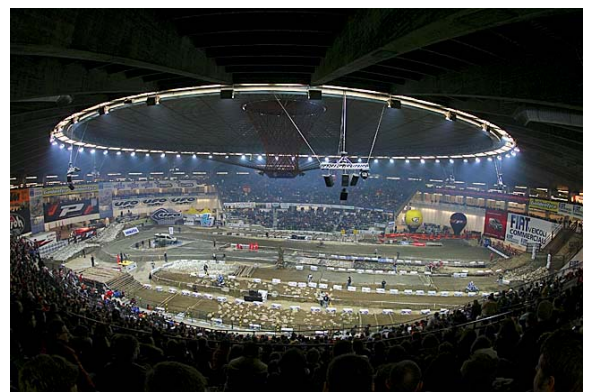
Mitreißende Atmosphäre in Genua.

Die Veranstaltung in Genua, als letzte von insgesamt drei Events, lockte zum Abschluss fast 10.000 Zuschauer in die Halle. Aufgrund des großen Zuspruchs des Indoor Events wird derzeit eine Serie mit 5-6 Rennen für 2008/2009 geprüft.